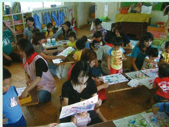
「わくわくクラブ」のにぎわい