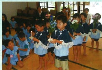
毎月 みんなで祝う 誕生日