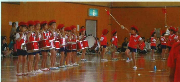
運動会での鼓隊演奏