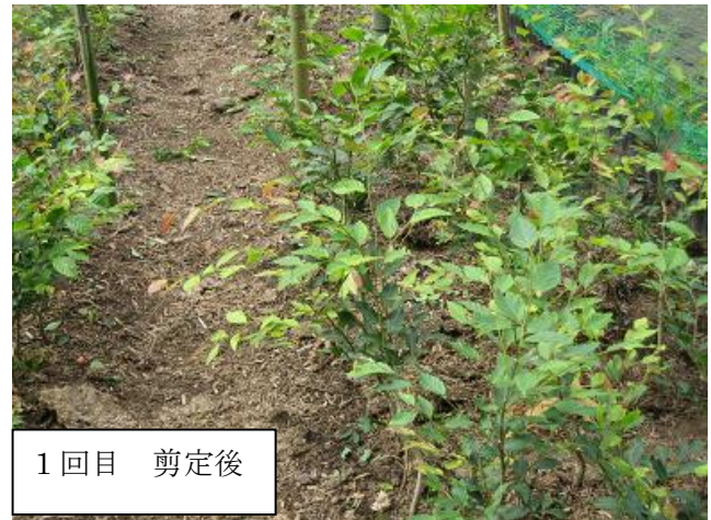
1 回目 剪定後