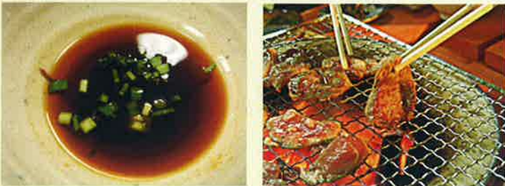
自家製醤油ダレで美味しさ 抜群