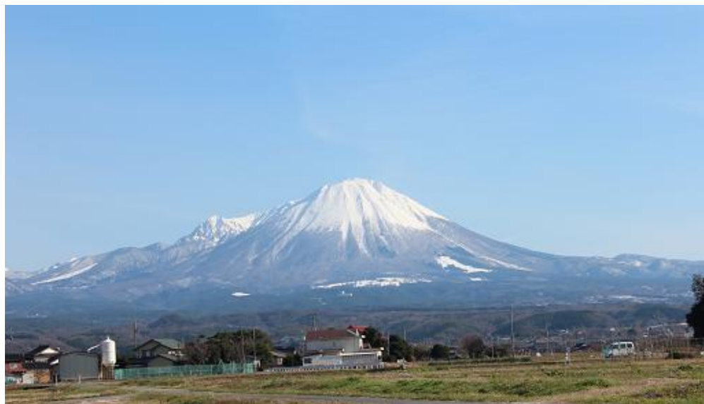
河岡付近より望む