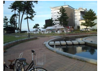
ロケーションは最高