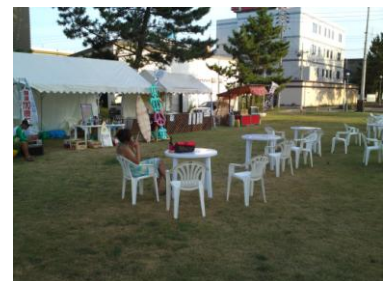
公園には 屋台村が出ることもある