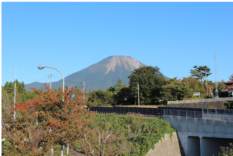
丸山先の展望台から望む