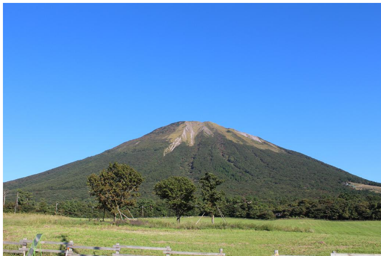
澄み切った空と 秀麗な大山は 相思相愛