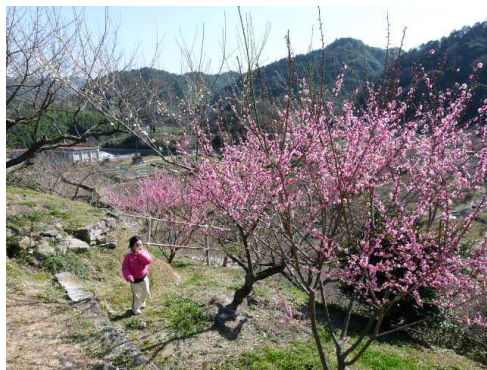
寒さを忘れ、思わず走り出す